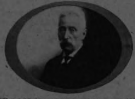
DOCTOR DON CARLOS DURAN

Sobre Costa Rica entera, en las esferas de la política y los campos de la ciencia, se extiende la sombra bienhechora de este sabio cuya primer década de fallecimiento tristemente se recuerda mañana 23 de los corrientes. Durán, político, ocupa un elevado puesto en los anales de nuestra historia; fue de los hombres que sin temor alguno aceptaron las responsabilidades de sus actos y que en dos ocasiones, en 1889 y en 1914, evidenciaron ante el país que sabía cumplir sus deberes cívicos y mantener los prestigios del orden en la tranquilidad a costa de los sacrificios que para él significaba el entrar a los campos de la acción política. Durán, médico, es un nombre universalmente reconocido, es una de las glorias científicas de la patria costarricense, que en alas de la fama científica ha volado para posarse en todos los centros de ciencia universal. Costa Rica no debe de permitir el olvido de esta memoria venerada y querida y por eso en esta primer década de su sentido fallecimiento, le recordamos con el mismo cariño con que llevamos su nombre al través de los pueblos cuando la mayoría de los costarricenses le proclamó para Presidente de la República en el cuatrienio de 1914 a 1918.